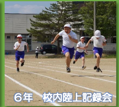
6年 校内陸上記録会